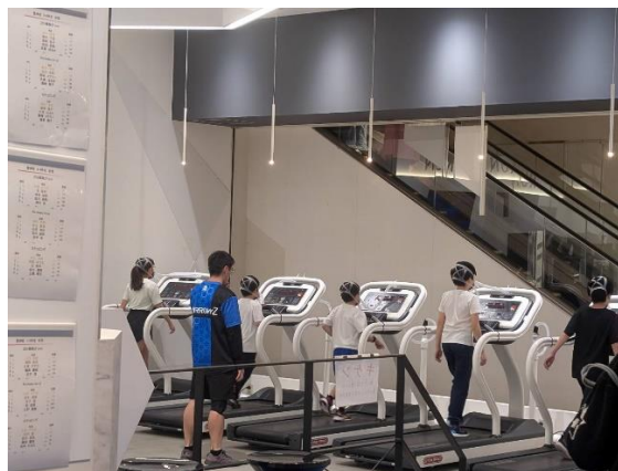
圖六、學童在模擬低氧的環境下進行心肺能力檢測。

除此之外，在檢測當天，我們也看到有一些國小學童在家長的帶領下，於實驗室進行五大基礎體力檢測(圖六)，並且將檢測結果儲存於資料庫，定期追蹤及公布排序，以作為未來選擇專項訓練之依據。