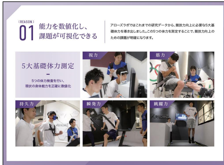
圖三、日本箭實驗室身體能力分類