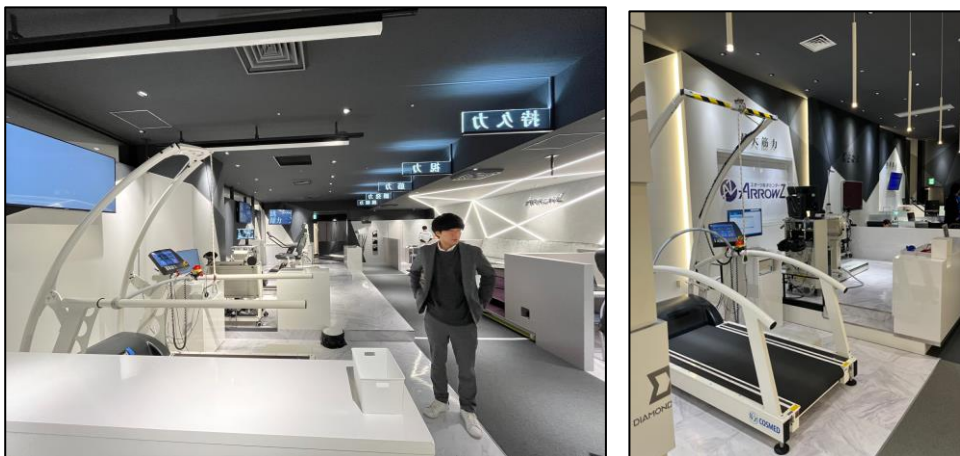
圖二、日本箭實驗室設施

箭實驗室將身體能力區分為五大基礎體力：動態視力(視力)、心肺能力(持久力)、爆發力(瞬發力)、最大肌力(筋力)、跳躍能力(跳躍力)，再依據每一個項目進行檢測（圖三）。